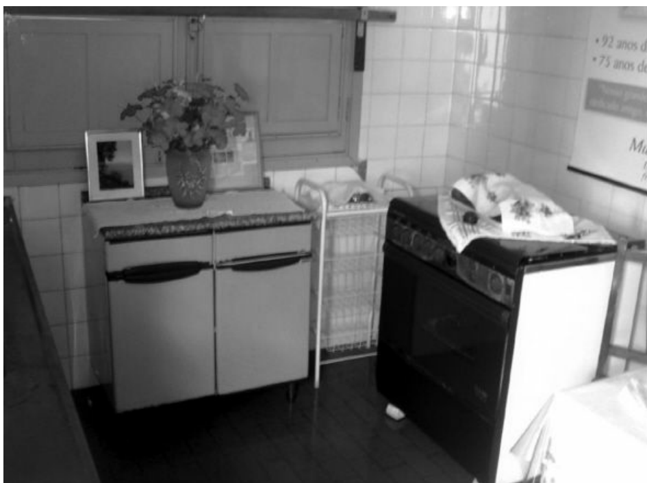
Cozinha onde o médium fazia suas refeições.