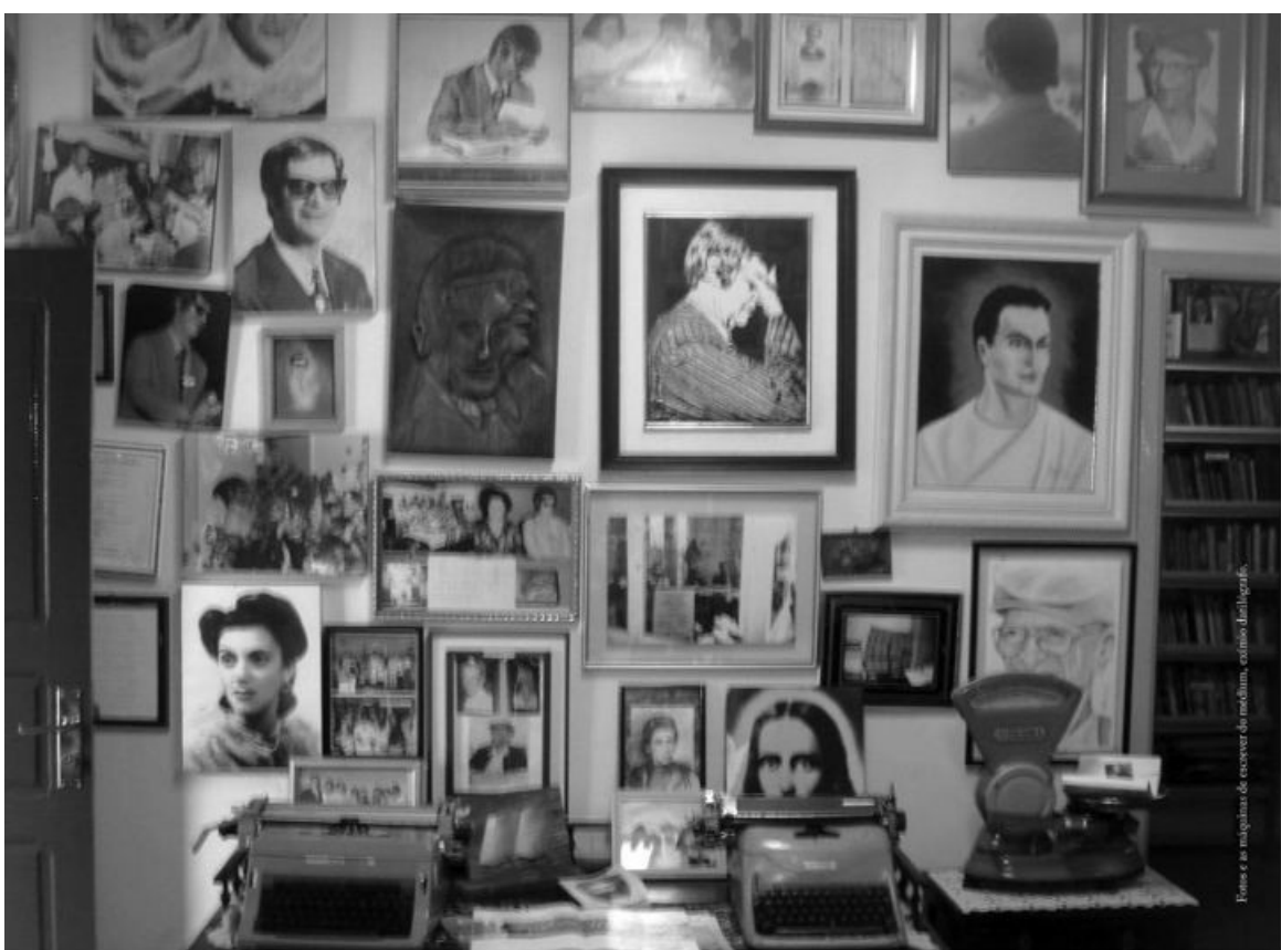
da mediana, crítico da Ilustração.