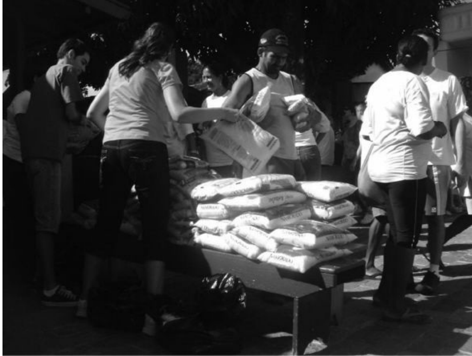
Distribuição de alimentos aos carentes no “abacateiro”.