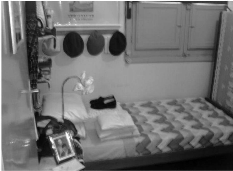
Quarto em que Chico Xavier dormia.