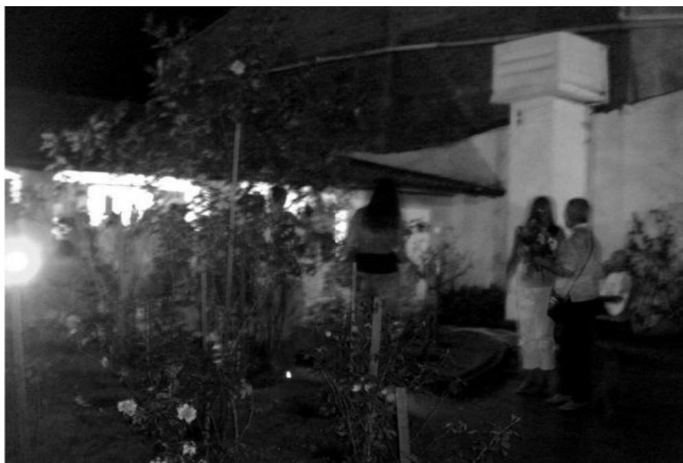
Jardim no Grupo Espírita da Prece.