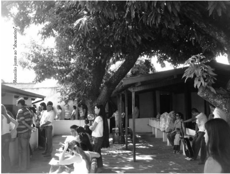
Reunião junto ao "abacateiro".