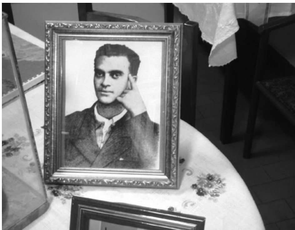
Imagem de Chico ainda jovem.