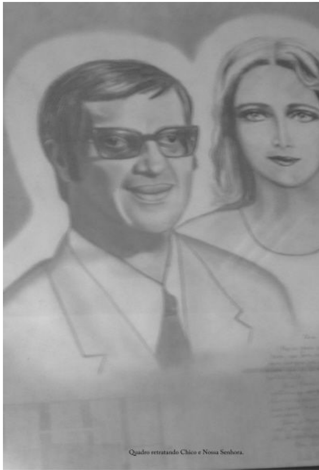
Quadro retratando Chico e Nossa Senhora.