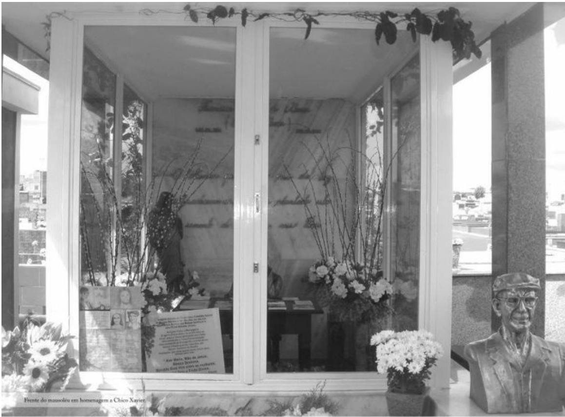
Frete do mausoléu em homenagem a Chico Xavier.